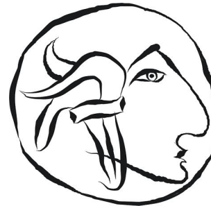
I.E.S. "Pablo Picasso"